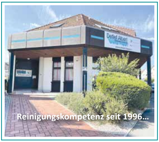
Reinigungskompetenz seit 1996...

Hanns-Braun-Straße 1a 95100 Selb E-Mail: info@albert.bayern Telefon: 09287/890 222 Homepage: www.albert.bayern Albert Gebäudereinigung